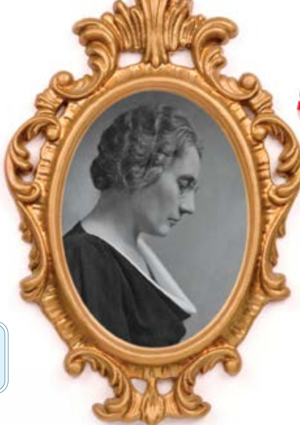
Yousuf Karsh / Bibliothèque et Archives Canada / PA-165870

LE SAVAIS-TU? — Agnes Macphail a été la première femme élue au Parlement. Elle a été députée à la Chambre des communes de 1921 à 1940.