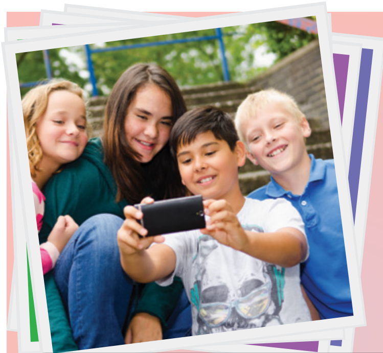
Frais mensuels liés à l'utilisation du téléphone intelligent chez les jeunes de 12 à 14 ans au cours des cinq dernières années